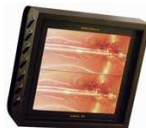
VARMA 400 DOBLE (2X1,5 Kw.) VARMA 400 DOBLE (2X2,0 Kw.) VERTICAL