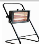
VARMA FIRE (2X1,5 Kw.)