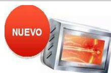
VARMA 400 (1x1,5 Kw.) IPX5 ACERO INOXIDABLE