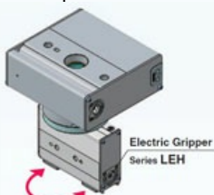
Transferencia rotativa combinada con amarre de pinza