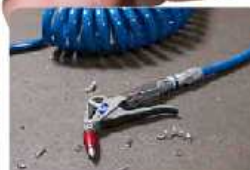
Resistente a medios agresivos