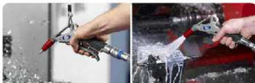
Caudal de aire y fluidos