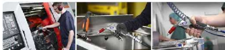
Gran caudal en procesos de limpieza, refrigeración y secado